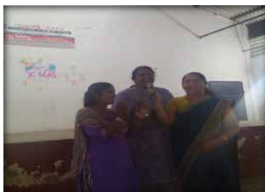
Christmas celebration- Cultural programmes by the people of locality