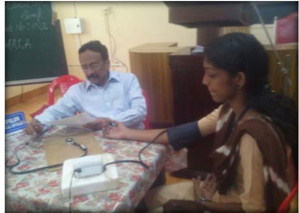
Blood donation camp