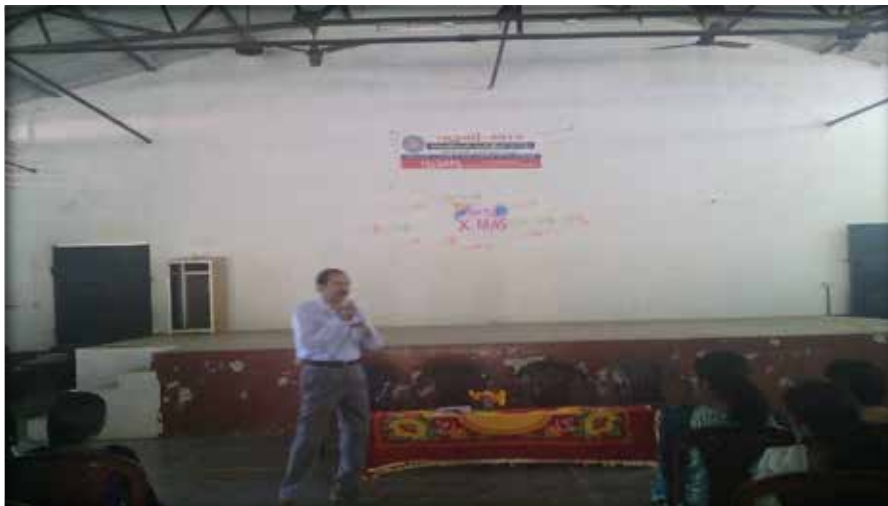
Awareness class by Agricultural officer, Vynthala