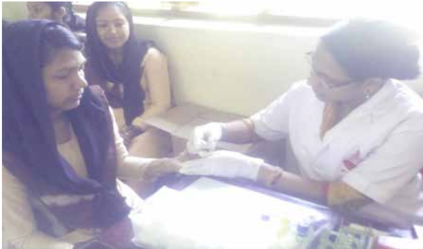
Diabetics Detection Camp