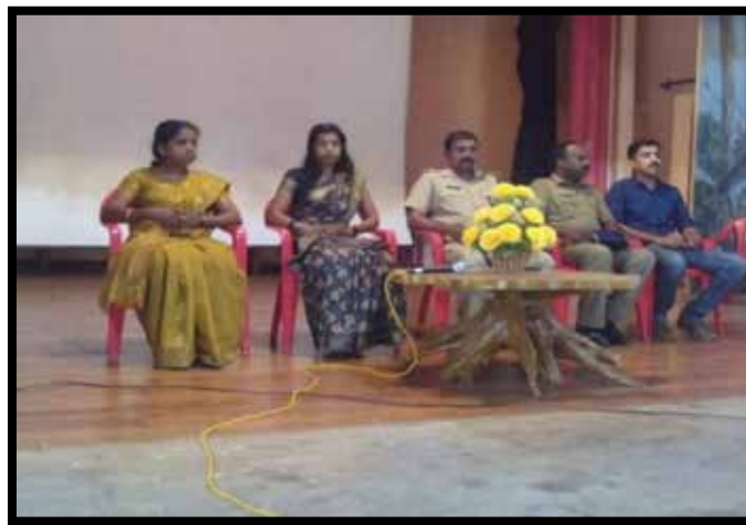
Awareness class by the Mobile Traffic Awareness Wing, Commissioners Office, Thrissur