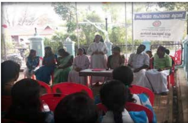
NSS Special Camp 2015-16