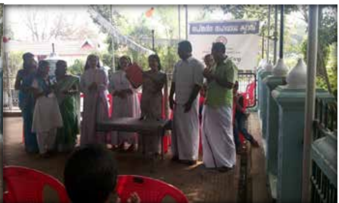
Hand written Magazine Release