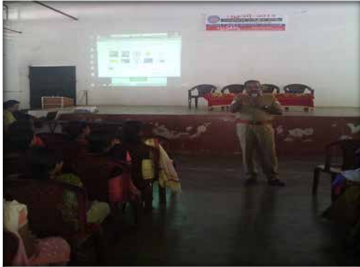
Awareness class by Department of Police Force