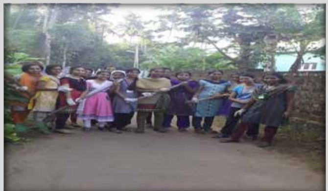
Cleaning activities undertaken during the Camp