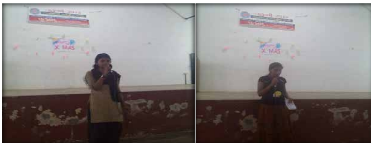
Cultural programmes by NSS Volunteers